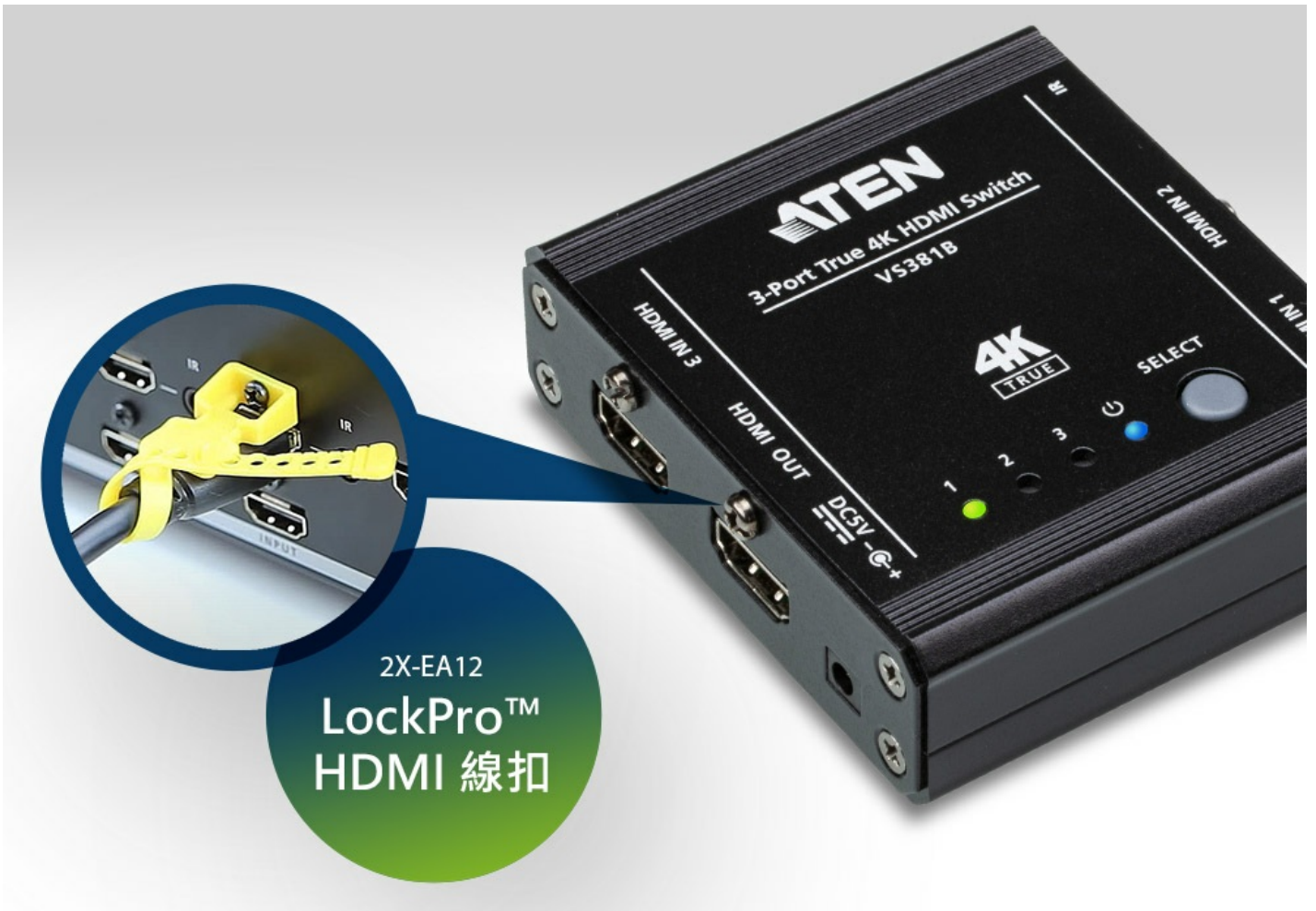
2X-EA12 LockPro™ HDMI 線扣