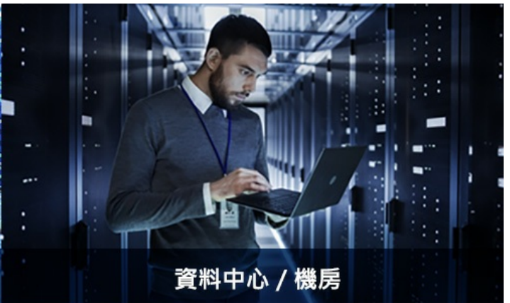
資料中心 / 機房