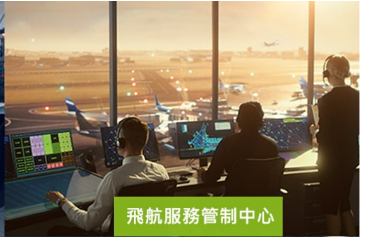
飛航服務管制中心