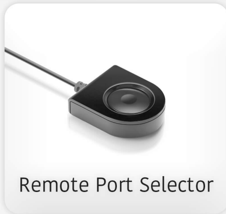
Remote Port Selector