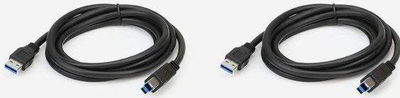
USB 3.0 A to B Cable