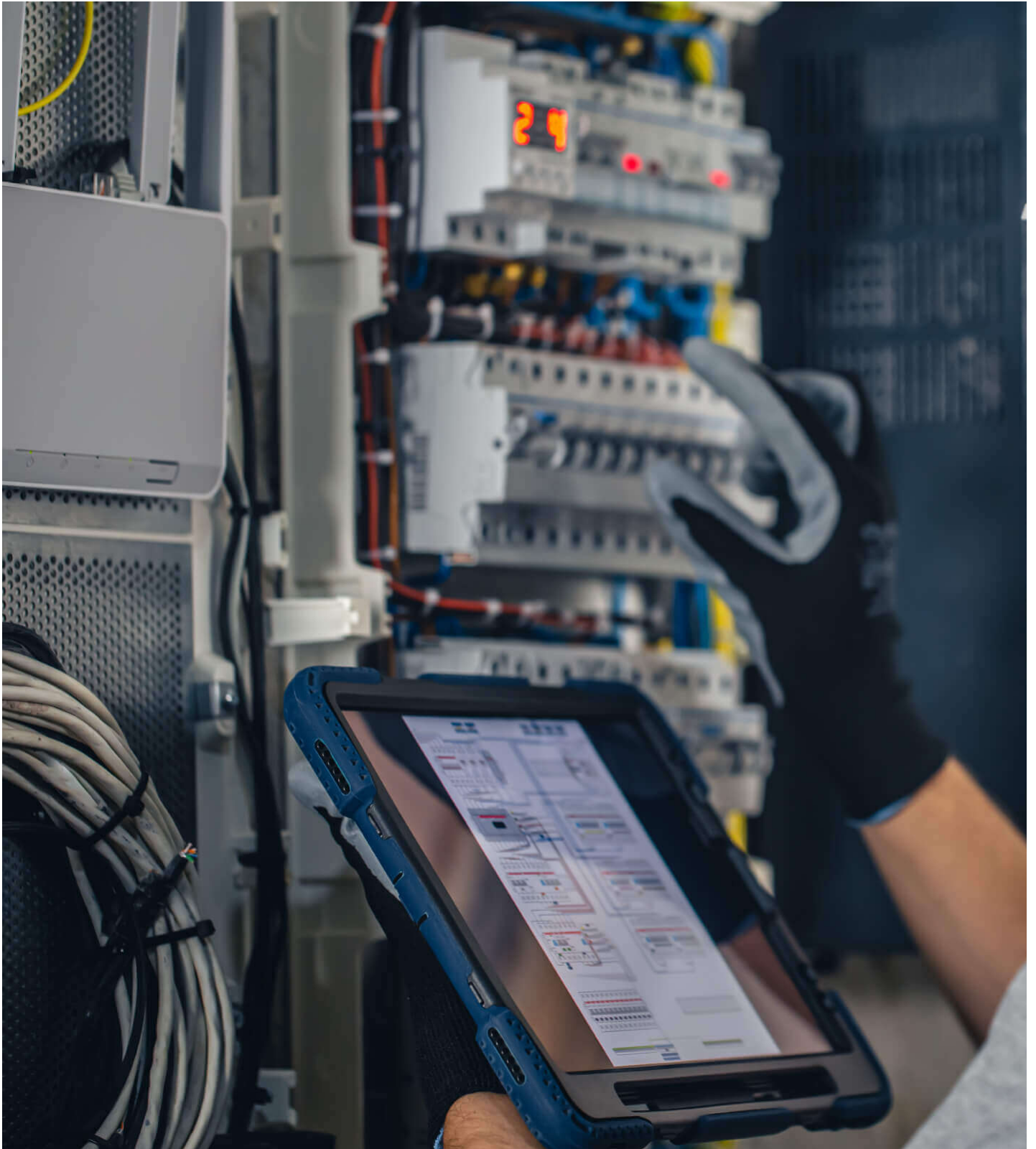
Underhåll av äldre utrustning