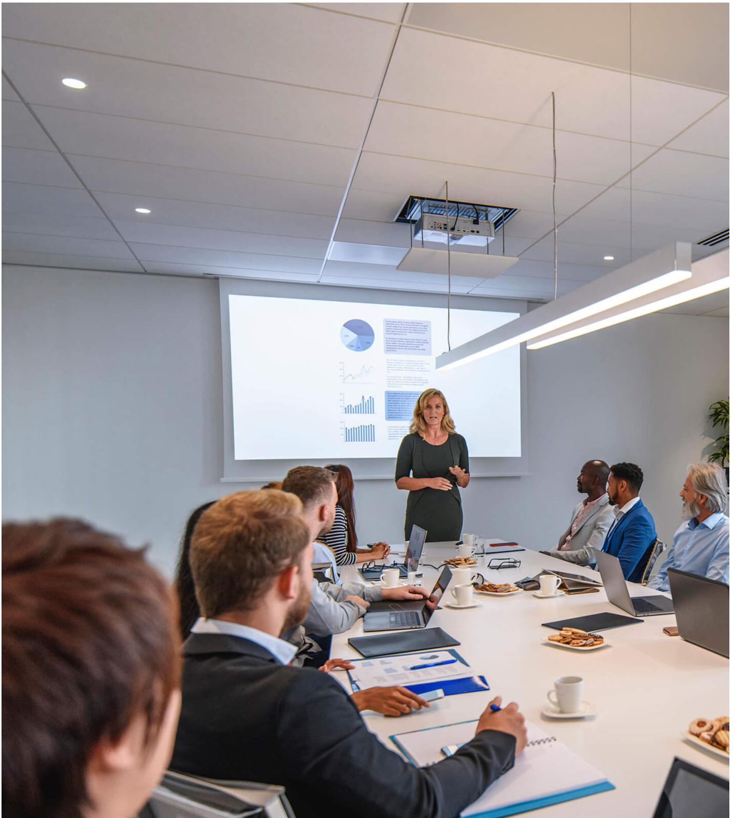
Sala de reuniões / escritório