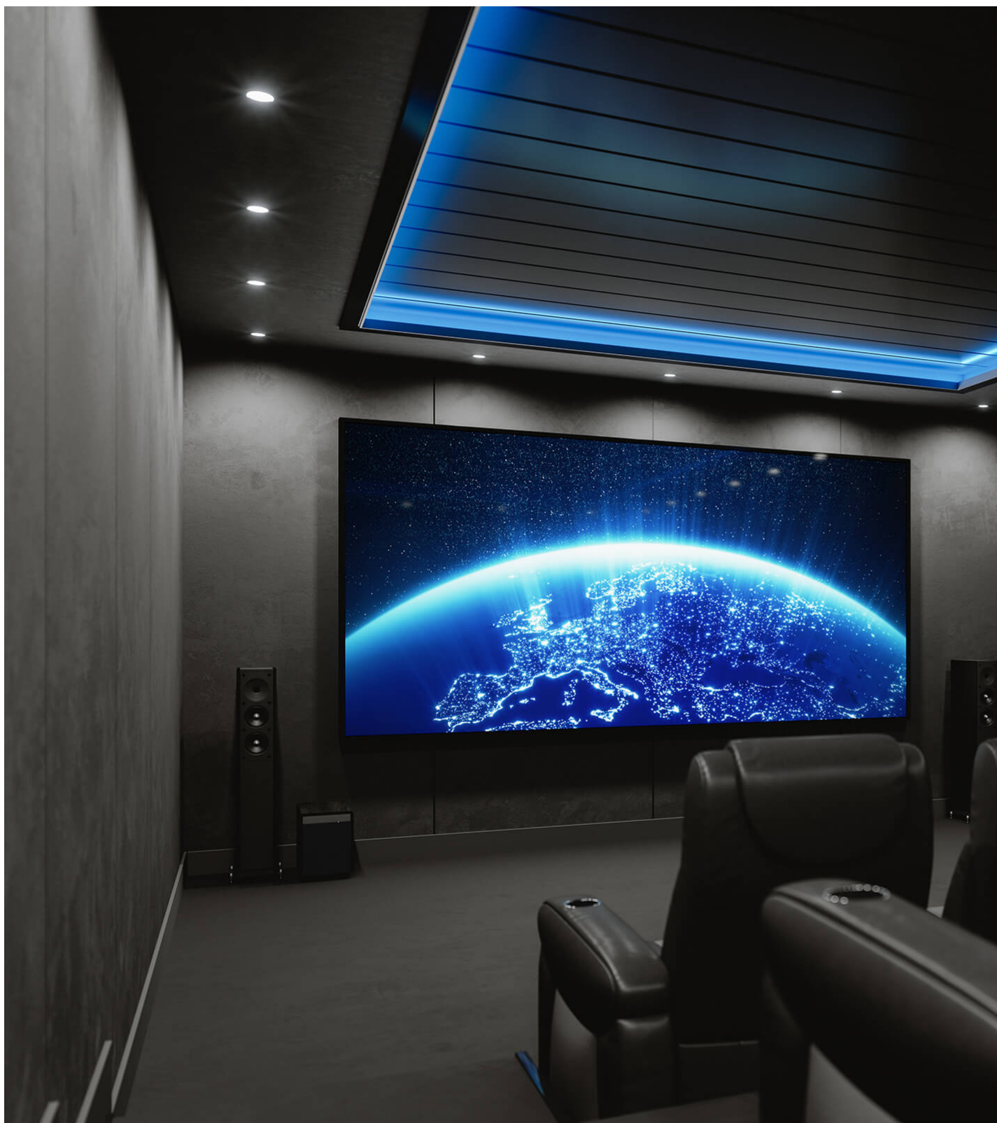
Cinema em casa