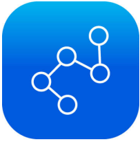
Long Distance Transmission