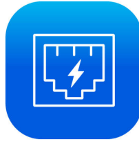
Power Over Cable