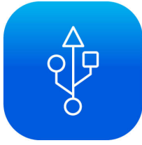
USB 3.2 Gen 1