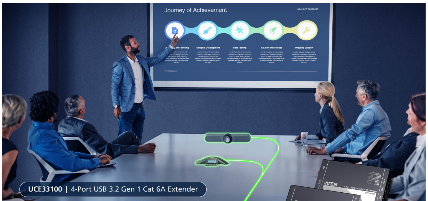
UCE33100 | 4-Port USB 3.2 Gen 1 Cat 6A Extender

Extend via Cat 6A, Enhance USB 3.2 and Serial Transmission Versatile Coverage up to 100 m