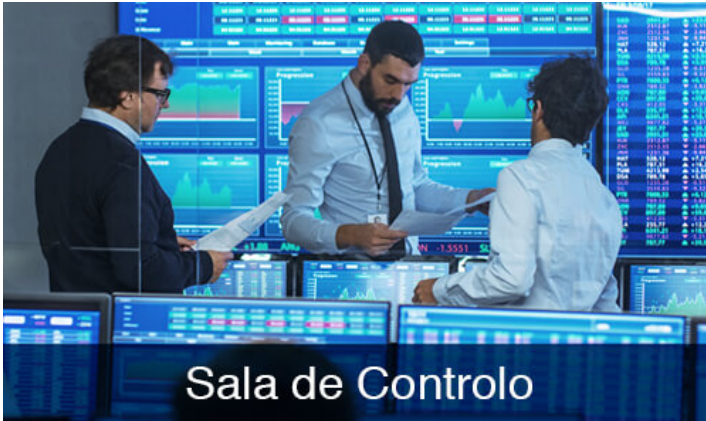
Sala de Controlo