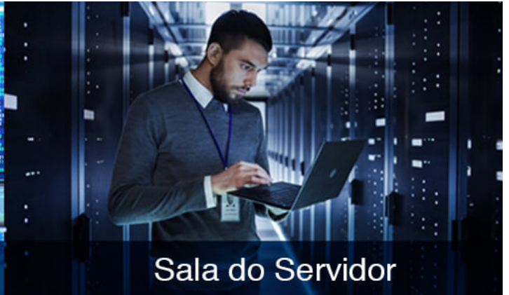
Sala do Servidor