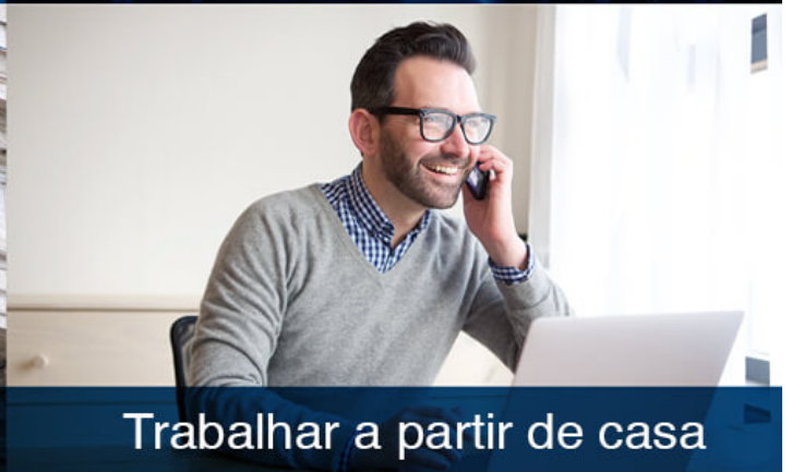
Trabalhar a partir de casa