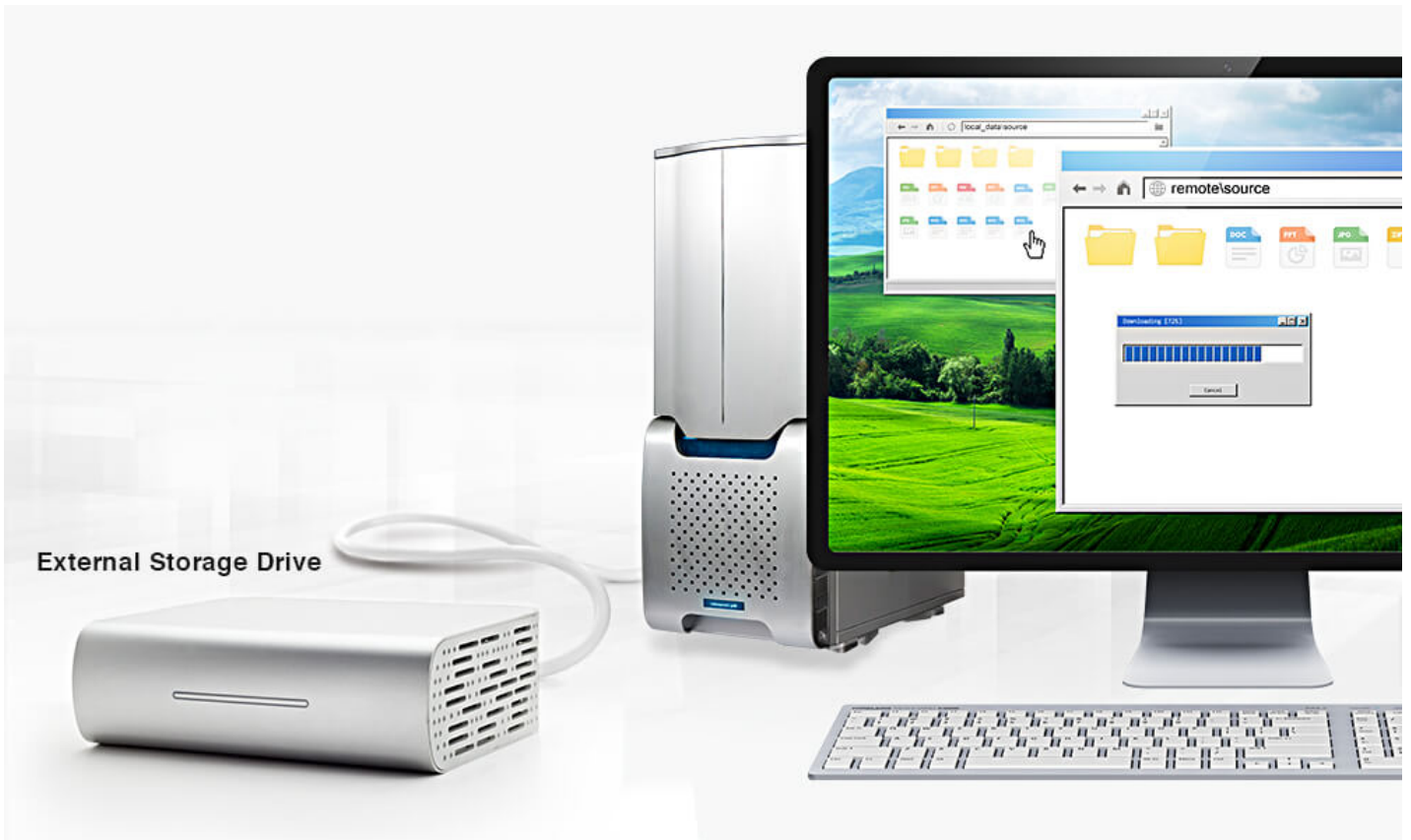
External Storage Drive