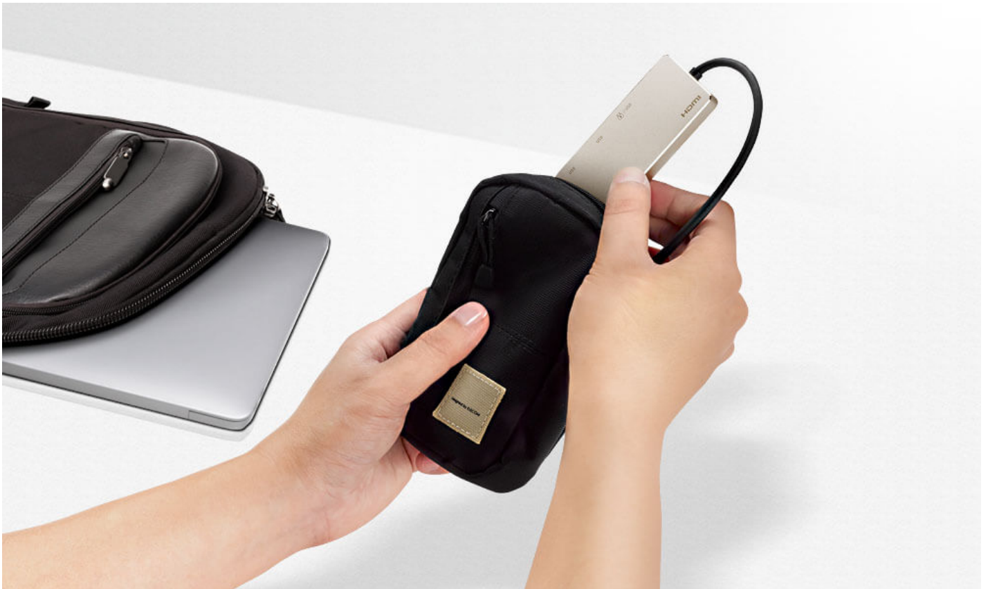
Diseño ligero y compacto con cable USB-C ultralargo