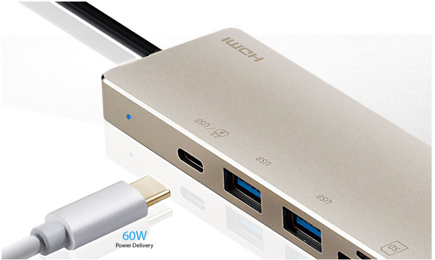
Una docking station para expandir todos tus dispositivos