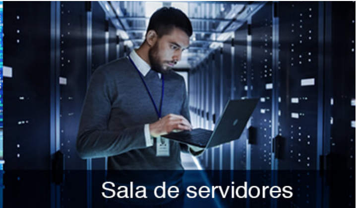
Sala de servidores