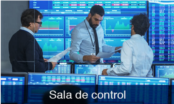
Sala de control