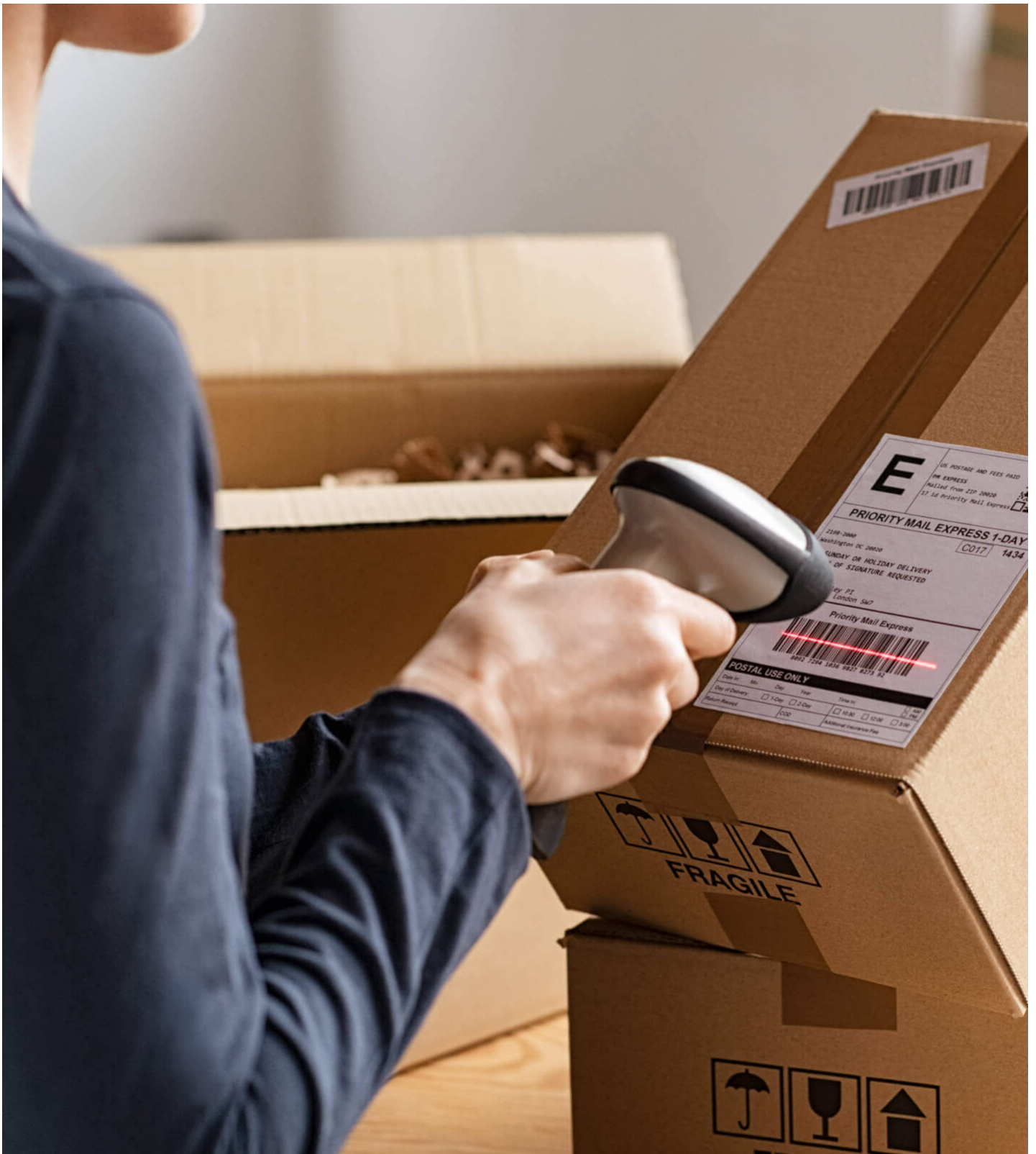
バーコードスキャナー