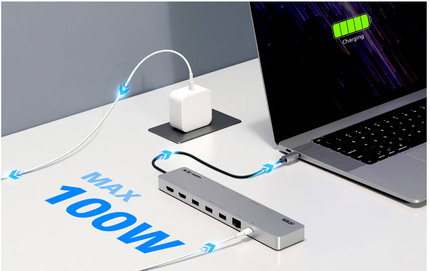
電源パススルー付き11-in-1 USB-Cドック